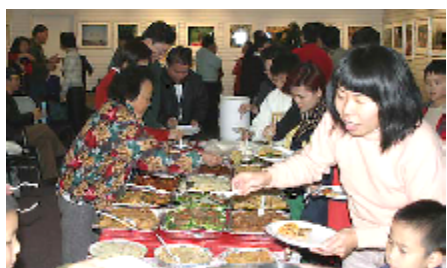
美食當前，食指大動