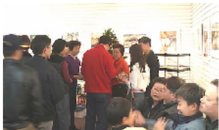
大家排隊，共襄善舉