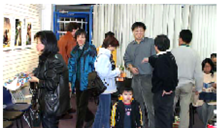
喜氣洋洋，圓滿收場